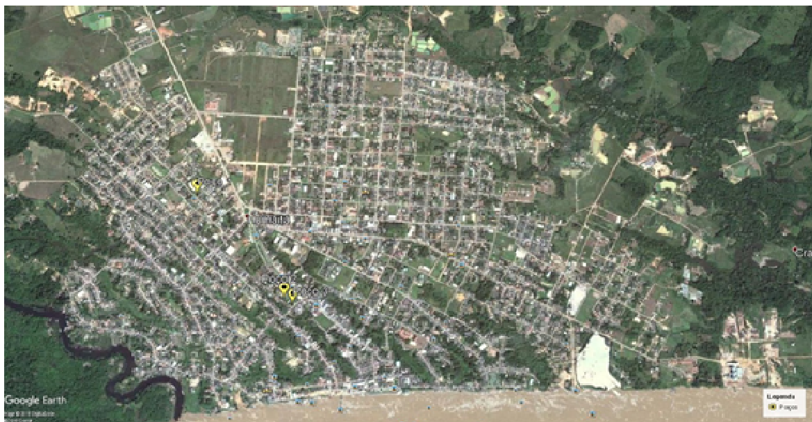
Figura 2. Localização dos pontos de coleta.

A pesquisa foi realizada no período seco no mês de julho de 2018, as amostras de água foram coletadas em apenas três poços, Na Figura 02, é mostrada a localização dos pontos de coleta (poços) numerados de 1 a 3.